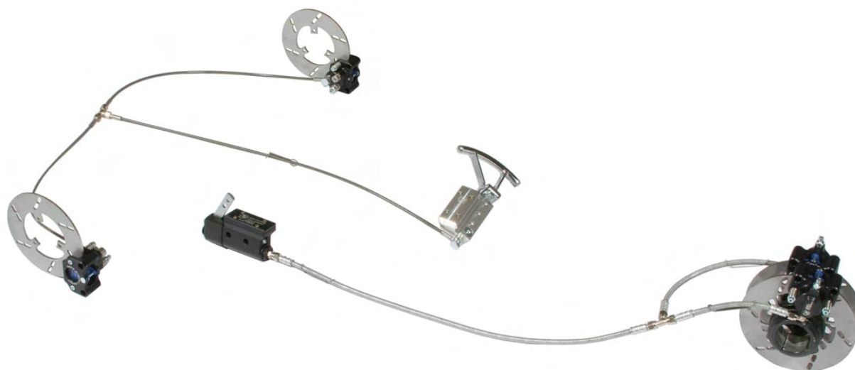
PHOTO VUE DE DESSUS DU SYSTÈME COMPLET ASSEMBLÉ

This Homologation Form reproduces descriptions, illustrations and dimensions of the brake system at the moment of the CIK-FIA homologation. The Manufacturer may modify them, but only within the limits set by the CIK-FIA Regulations in force.