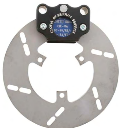
Photo du frein avant : étriers et disques seulement Photo of front brake: calipers and discs only