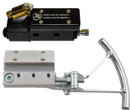
Maître-cylindre / Master-cylinder