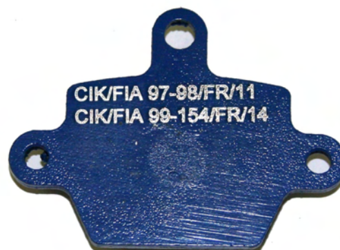
Plaquettes / Pads